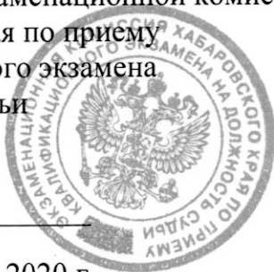
График проведения заседаний